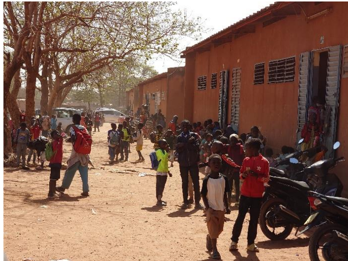
Bilder från skolan Nieneta A under 10-rasten. Foto: Sten Hagberg i februari 2024.

Projektet handlar om att förbättra tillgången till toaletter på skolan och främja kunskap om reproduktiv och sexuell hälsa bland skolflickorna. För det första ska projektet bygga toaletter till skolan Nieneta A, som har 790 elever i åldrarna 6-16 år; dessa toaletter ska enbart användas av flickorna (f.n. 403 stycken) och deras kvinnliga lärare. För det andra ska projektet reparera befintliga toaletter att användas av pojkarna (f.n. 387 stycken) och deras manliga lärare. För det tredje ska projektet bekosta utbildning i hygien och hälsa så att kunskapen och medvetenheten om dessa frågor ökar. Frågan om underhåll är central för projektet. Genom ett roterande veckoschema ska flickorna turas om att städa och underhålla deras toaletter; pojkarna ska städa och underhålla deras toaletter.